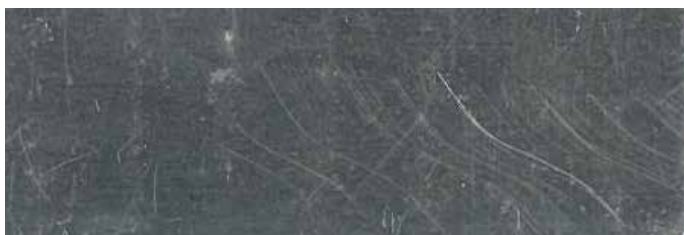
KROK 1: Surowe aluminium