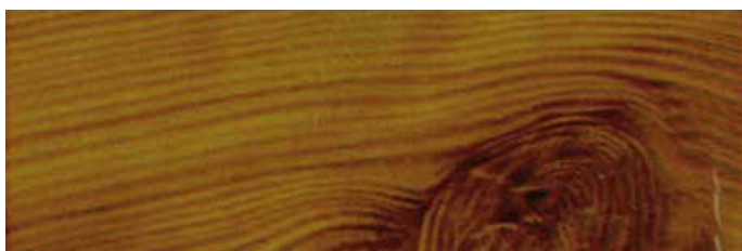
KROK 4: Gotowy wzór na aluminium