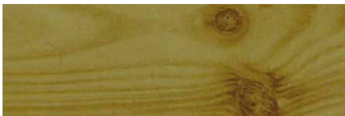
KROK 3: Powlekanie aluminium